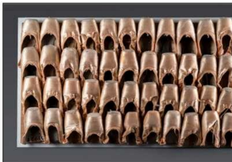
Grand Corps / Dynamique immobile (103x58cm)

Découvrez les oeuvres du danseur-chorégraphe et directeur de compagnie Jean-Charles Gil lors de l'exposition "Passion", à l'Abbaye de Silvacane du 13 juillet au 8 septembre.