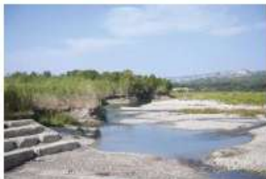
L'amphithéâtre de l'épi des Paisses

Ce parcours, d'une longueur de 10 km, vous emmène sur les rives de la Durance pour profiter de la fraîcheur de sa forêt alluviale, apprécier les points de vue sur la rivière ou le massif du Luberon et longer les vergers de la plaine agricole. Confortable, sécurisé, accessible aux sportifs et aux familles, le parcours est jalonné d'aires de pique-nique, d'espaces de repos, de contemplation et d'information sur la biodiversité durancienne.