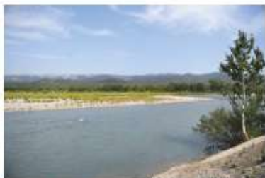
Vue sur la Durance à l'épi du Colombier