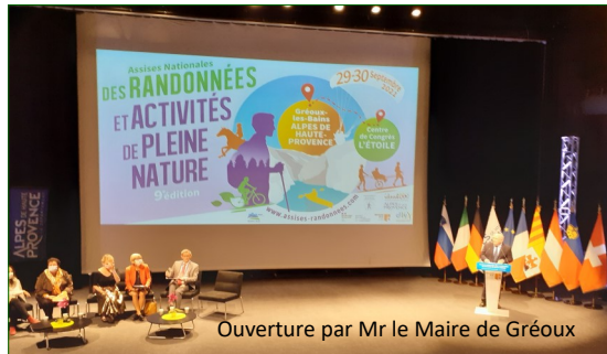
Ouverture par Mr le Maire de Gréoux

Ces Assises ont parlé Montagne et re montagne : il y a pourtant une plaine qui risque d'être à la peine !.... Les stations de moyenne montagne désenneigées engagent leur métamorphose et s'apprêtent à piétiner les plates-bandes d'un secteur méridional qui commençait à appréhender l'importance des ARN !.. Le tourisme vert de la Provence méridionale pourrait bien faire les frais du réchauffement climatique par manque de lucidité stratégique de ses instances de gouvernance : la Montagne : Mais c'est bien sur !.