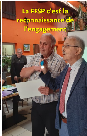
La FFSP c'est la reconnaissance de l'engagement