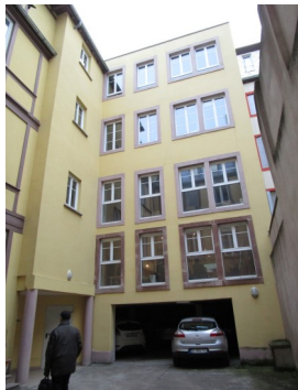
La FFSP c'est 1 immeuble À côté de la gare de Strasbourg (Alsace)

Certains peuvent vous présenter les 3 CONTROLEZ ET TAMPONNEZ : c'est de l'Or