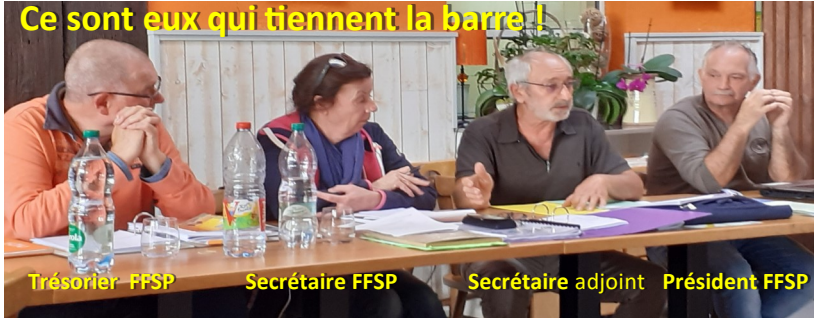
Trésorier FFSP Secrétaire FFSP Secrétaire adjoint Président FFSP

Tonnerre de Brest : Bon courage moussaillons et que les vents vous poussent