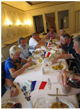
La FFSP ce sont des moments joyeux de partage et de convivialité