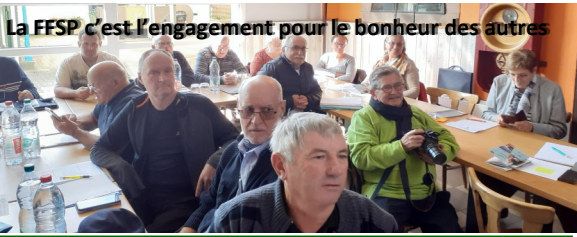
La FFSP c'est l'engagement pour le bonheur des autres

Et si demain un marcheur Martien vert se présentait dans un de nos Offices de tourisme et demandait à faire valider son Passeport sportif IVV Intersidéral Volkspport Verband